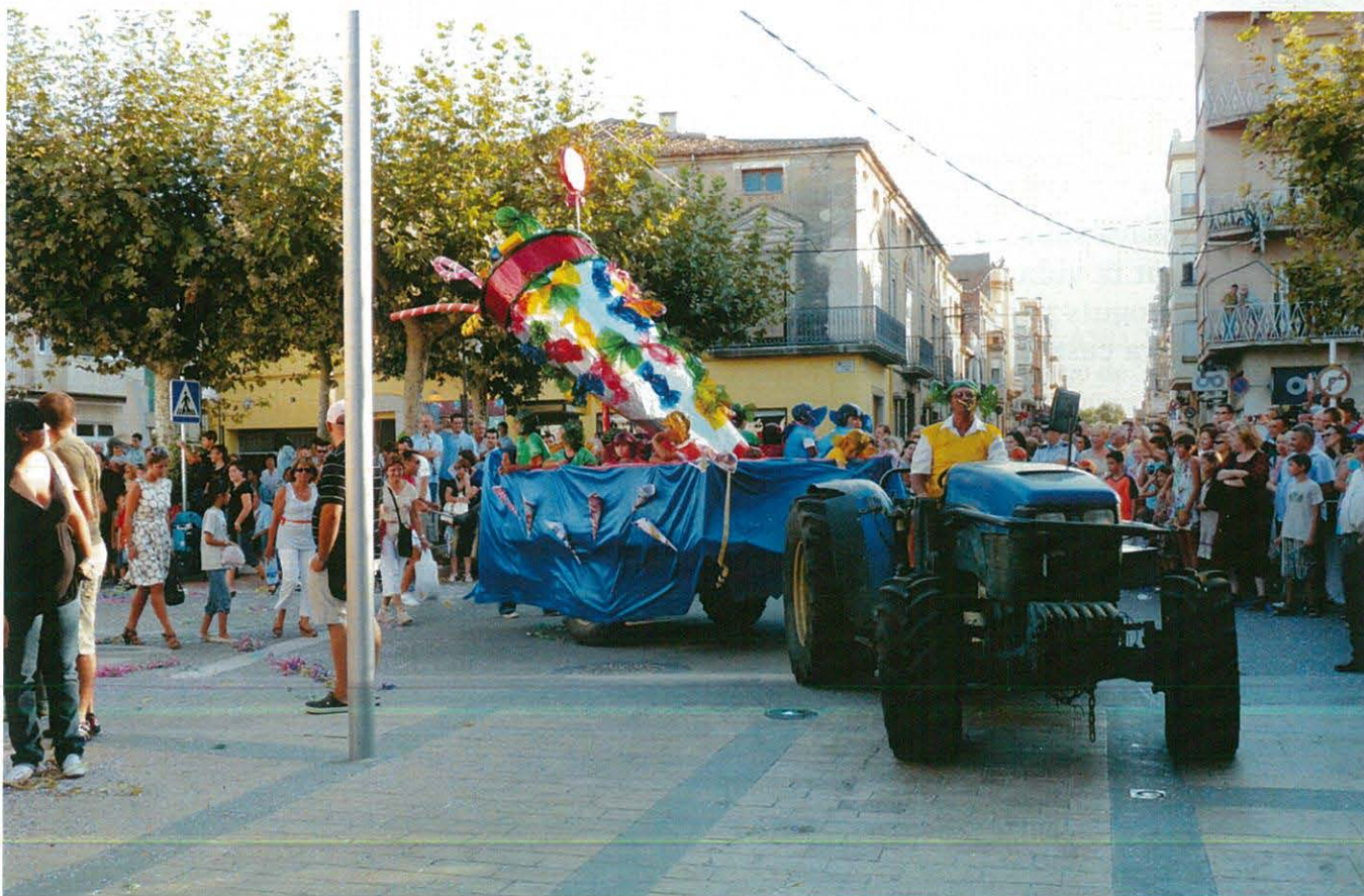
Carrossa de Festes del Centre Cultural Recreatiu